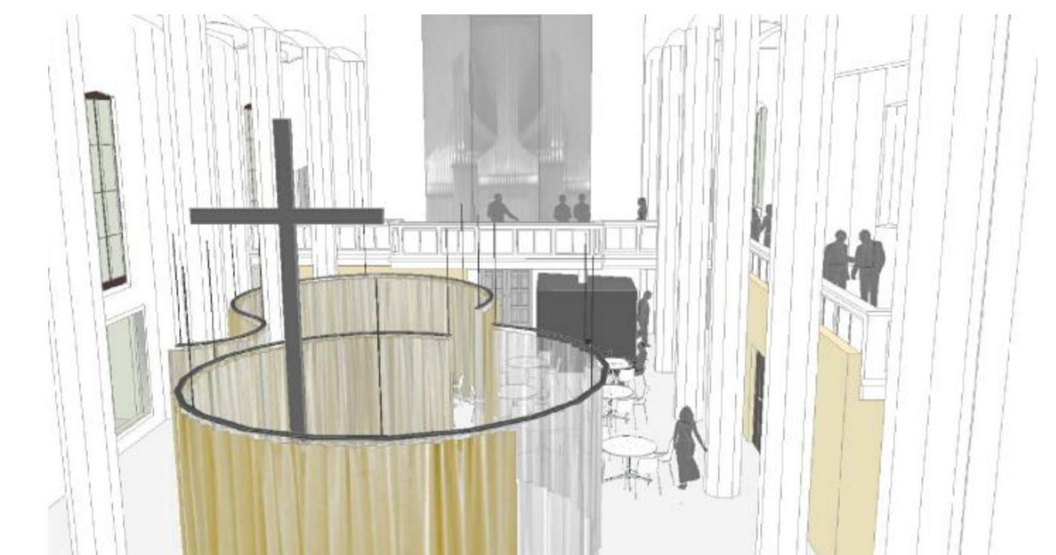
Blick zur Orgel