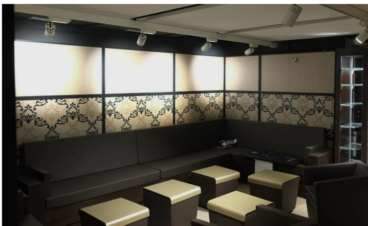
Wolsdorff Tobacco GmbH EG: Tabakwarenfachgeschäft UG: Tabak Lounge

Kettwiger Straße 2, 45127 Essen, Tel. 0201-225824