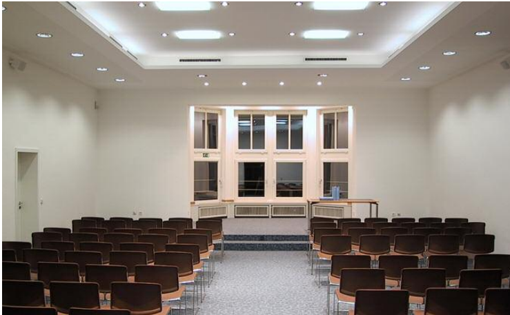
Metallverband Dortmund Lichtkonzept des Veranstaltungssaals, des Flurs und Arbeitsplätze