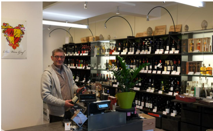
Der WeinGraf Wein, Spirituosen und Feinkost

PROJEKTUMFANG: RAUMKONZEPTION LADEN-/MÖBELBAU LICHTPLANUNG AKUSTIKKONZEPT KOORDINATION