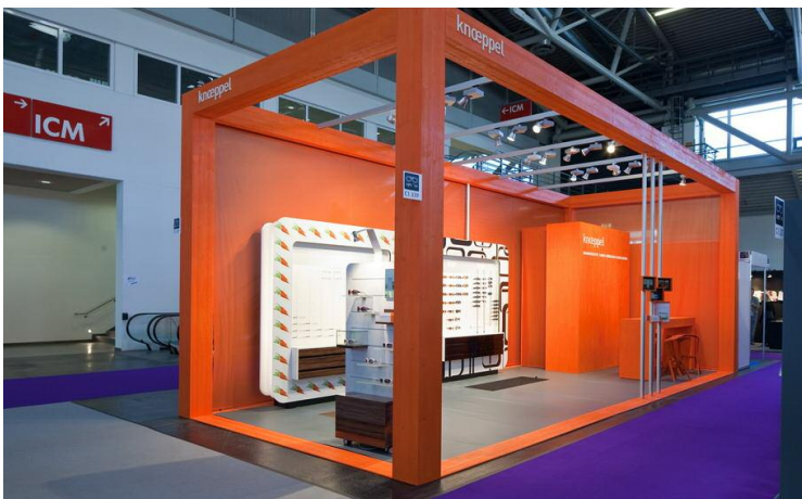
Knoeppel Messestand auf der Opti 2010 Präsentation der neu entwickelten Optikermöbel

PROJEKTUMFANG: KONZEPTION MESSE-/MÖBELBAU LICHTPLANUNG KOORDINATION