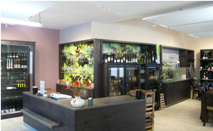
Weinstudio Pfalz GmbH Wein, Degustationsbereich