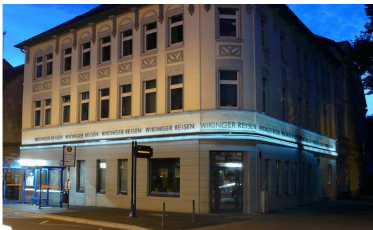
Wikinger Reisen GmbH Schriftband, Außenbeleuchtung

Wikinger Reisen GmbH, Kölner Straße 20, 58135 Hagen, Tel. 02331-90 46