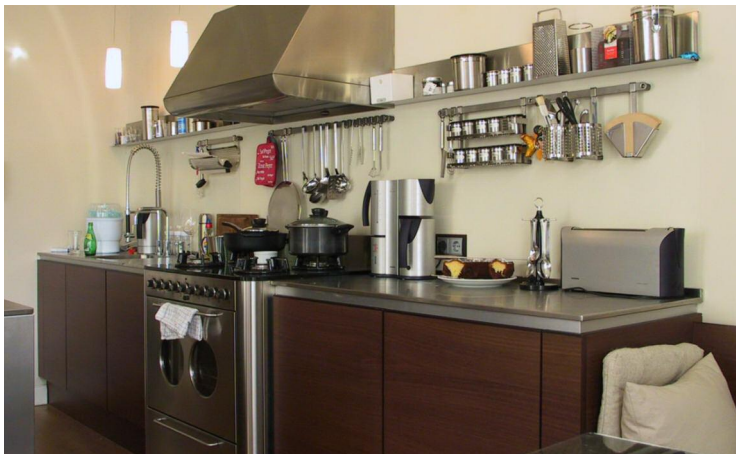
Küche und Bad in einer Stadtvilla in Hagen

PROJEKTUMFANG: RAUMKONZEPTION MÖBELBAU LICHTPLANUNG KOORDINATION