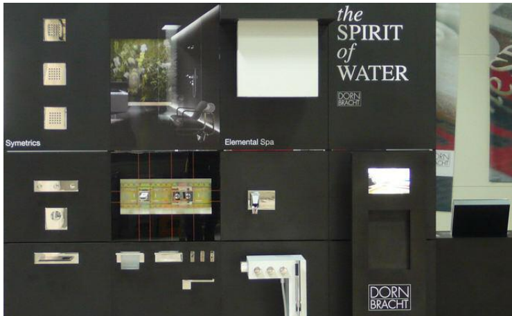
Dornbracht POS-System Präsentationswand für Armaturen, modulares System

Dornbracht GmbH und Co.KG, Köbbingser Mühle 6, 58640 Iserlohn, Tel. 02371-4330