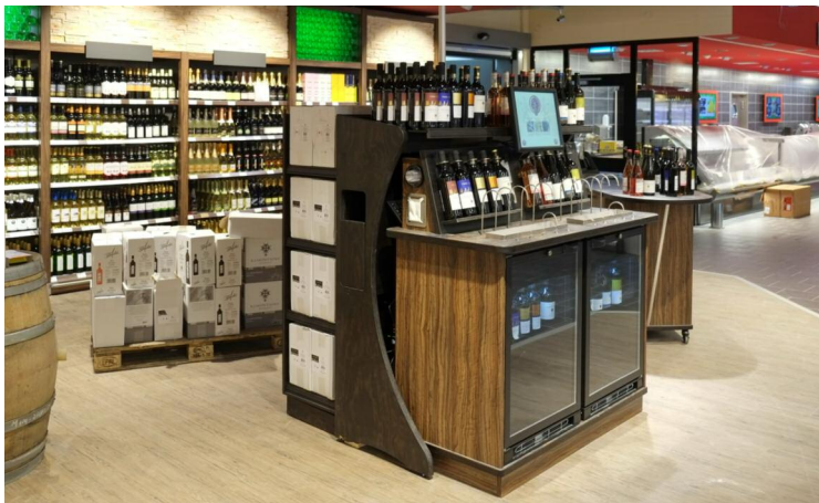
Markant Fritz Feldmann GmbH & Co. KG

Alte Weide 7, 24116 Kiel, Tel. 0431 - 1696 145