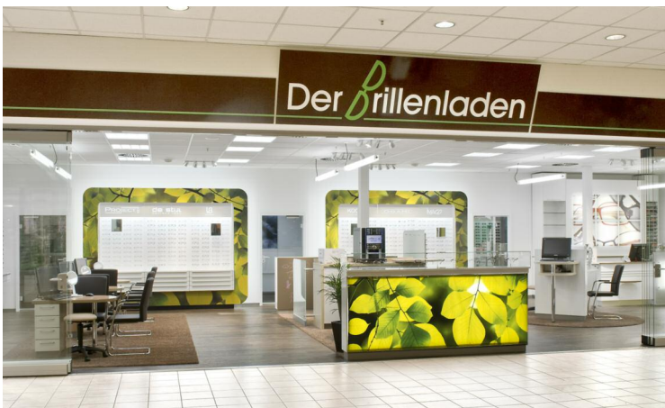
Der Brillenladen Optikerfachgeschäft

PROJEKTUMFANG: RAUMKONZEPTION LADEN-/MÖBELBAU LICHTPLANUNG AKUSTIKKONZEPT KOORDINATION