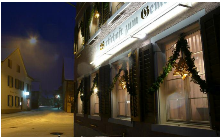
Gemeindehaus Beringen Gastro GmbH Eingang Vinothek, Außenbeleuchtung