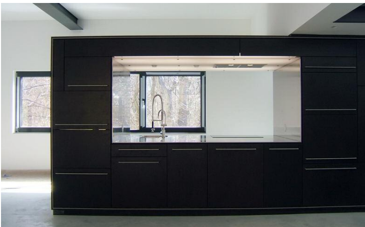
Küchenkubus als raumgliederndes Element in einem Loft in Herdecke

PROJEKTUMFANG: RAUMKONZEPTION MÖBELBAU LICHTPLANUNG KOORDINATION