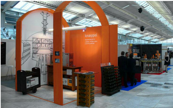
Knoeppel Messestand auf der Korn&Friends 2010 Präsentation der neu entwickelten Pendelleuchte Exponat und Raum, Weinmöbel mit Verkaufsaktivität

PROJEKTUMFANG: KONZEPTION MESSE-/MÖBELBAU LICHTPLANUNG KOORDINATION