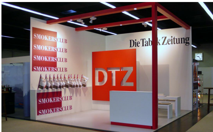
Messestand DTZ Die Tabak Zeitung, Smokers Club, Messe Intertabac, Dortmund

PROJEKTUMFANG: TECHNISCHE ENTWICKLUNG MÖBELBAU