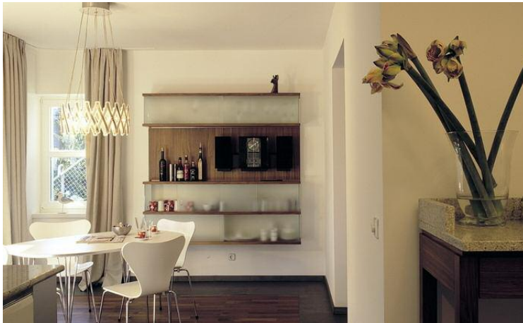
Küche und alle Wohnbereiche in einer Villa in Wetter

PROJEKTUMFANG: RAUMKONZEPTION MÖBELBAU LICHTPLANUNG KOORDINATION