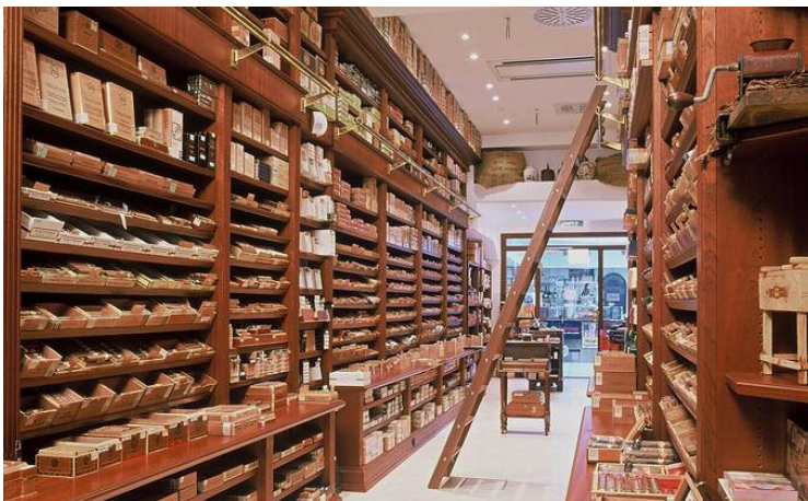
Pfeifencenter Peter Linzbach Tabakwaren Groß- und Einzelhandel Humidorausstattung 150 m 2

PROJEKTUMFANG: RAUMKONZEPTION LADEN-/MÖBELBAU LICHTPLANUNG AKUSTIKKONZEPT KOORDINATION