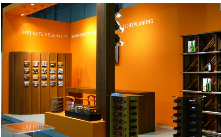
Knoeppel Messestand auf der Pro Wein 2009 Präsentation der neu entwickelten Weinmöbel mit Verkaufsaktivität

PROJEKTUMFANG: KONZEPTION MESSE-/MÖBELBAU LICHTPLANUNG KOORDINATION