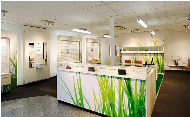
Optik Olbrich Optikerfachgeschäft, CHANGE IT Konzept

PROJEKTUMFANG: RAUMKONZEPTION LADEN-/MÖBELBAU LICHTPLANUNG KOORDINATION