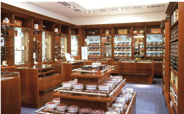
Wilhelm und Richard Diehl Tabakwarenfachgeschäft Walk-in-Humidor, Ladenausstattung Lederwarenfachgeschäft

PROJEKTUMFANG: RAUMKONZEPTION LADEN-/MÖBELBAU